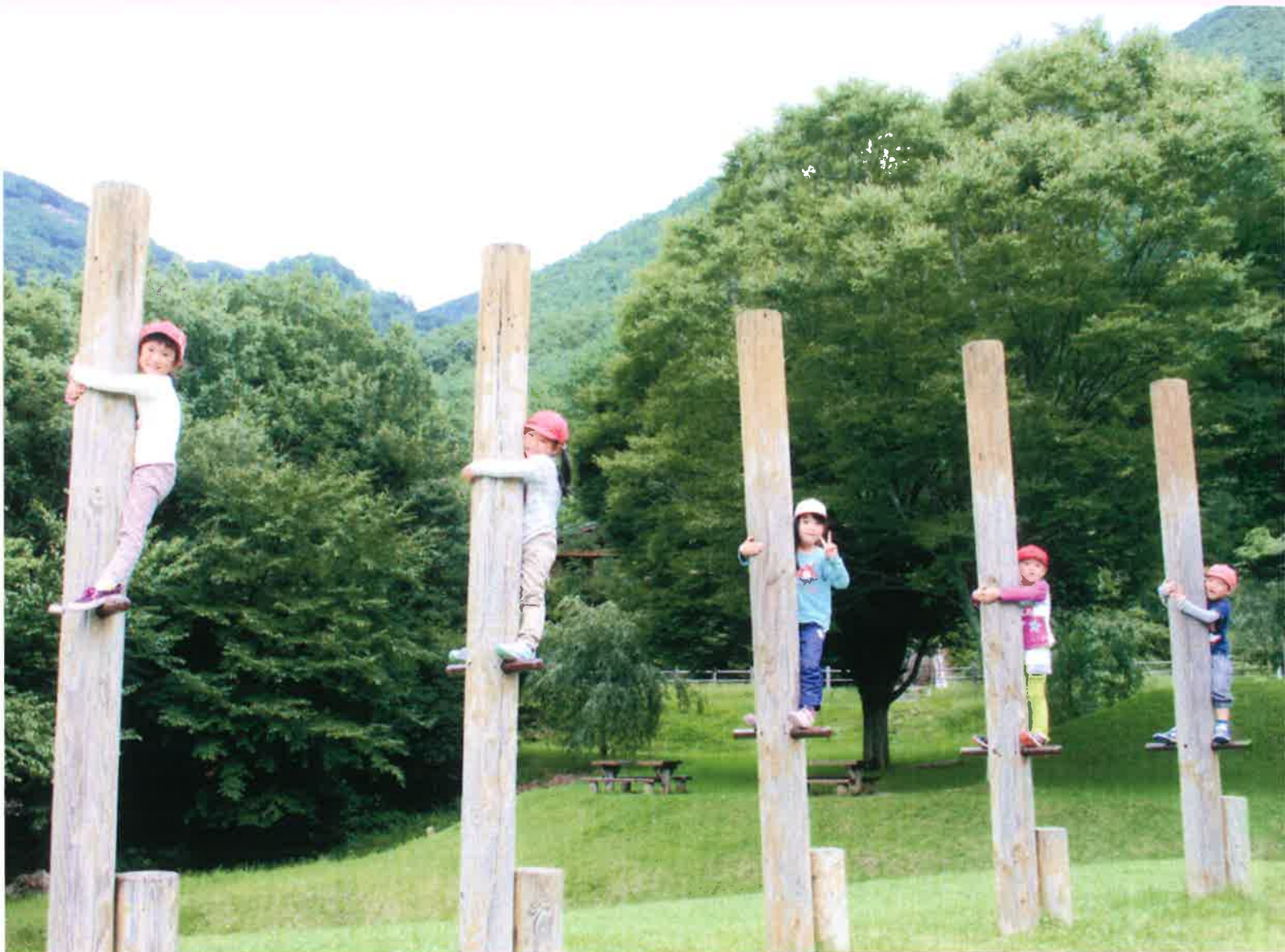
平成26年度 今羽・本郷保育園 合同林間保育 (塩原温泉家族旅行村「箱の森 プレーパーク」にて)