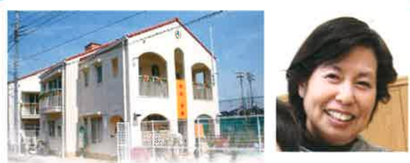
ルミエール保育園

立地的に、最寄りの駅から徒歩で20分程かかり、交通の便がよいとはいえませんが、まみ保育園の良さをもっと作り続け、発信し、地域の皆様の子育てを支援していきたいと思えます。