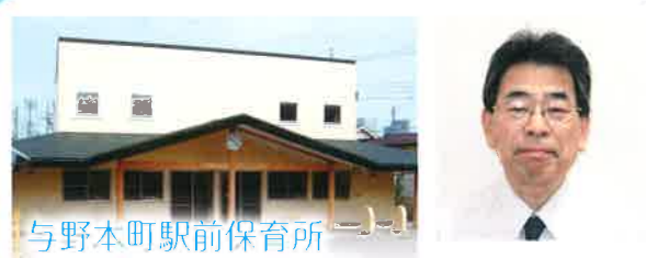
与野本町駅前保育所

スタッフは連携を密にし、風通しの良さと離職率の低さも当園の特長です。有給休暇の取得率も高く、働きやすい環境づくりに努めています。